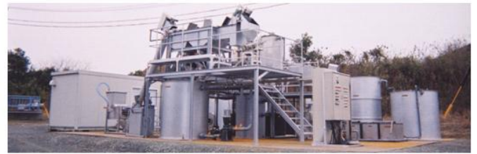
使用済み紙おむつ実証実験プラント全景