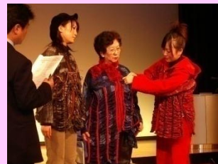
シルバー・ニューウェーブ・ファッションショー

【知的財産等情報】 実用新案登録「使用済み紙おむつ用破碎分離回収装置」登録3139358号