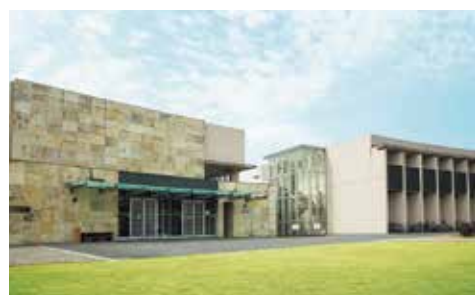
国際交流会館国際交流棟外観