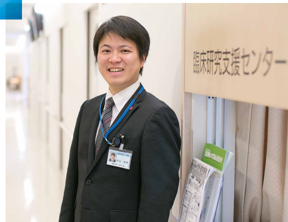
福岡大学病院臨床研究支援センター事務室

VOICE 大学病院での仕事は地域貢献と社会的使命に応えることができます。ガッツのある人、お待ちしております!!