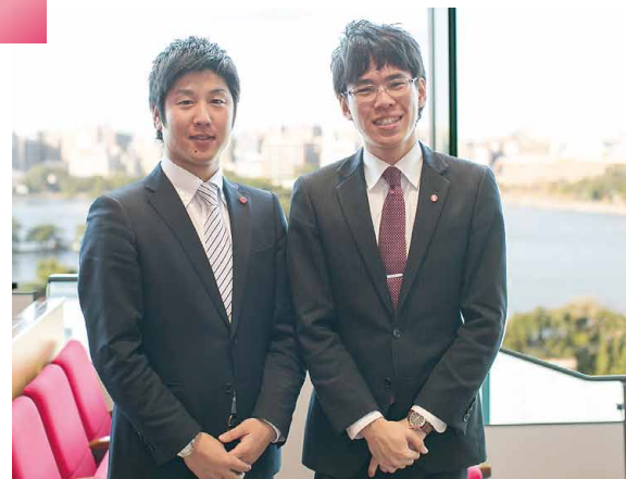
附属大濠高等学校・中学校事務室