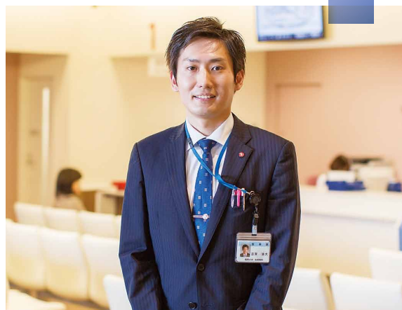
福岡大学筑紫病院医事課